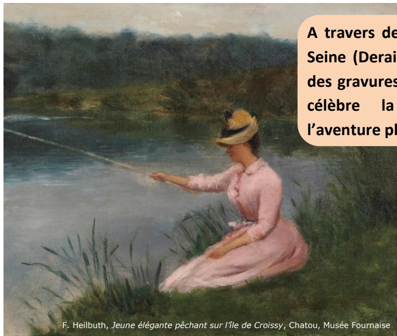
F. Heilbuth, Jeune élégante pêchant sur l'île de Croissy, Chatou, Musée Fournaise

A travers des peintures des Petits Maîtres de Bords de Seine (Derain, Lebourg, Réalier-Dumas, De la Villéon...), des gravures et différents objets, la collection du musée célèbre la beauté des paysages d'Île de France et l'aventure pleine d'humour des canotiers.