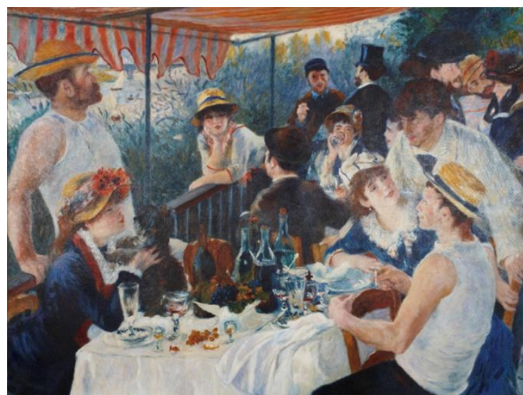
Renoir, Le Déjeuner des Canotiers , Washington, Phillips Collection

Son établissement devient alors une guinguette réputée, lieu de rencontre des gens de lettres (Maupassant...), des peintres et des personnalités à la belle saison. Les artistes se pressent sur les bords de Seine, en quête de cette lumière mobile sur la rivière. Le charme du site attire Renoir, qui y peint une trentaine de toiles et y immortalise ses amis dans le célèbre Déjeuner des canotiers . « J'avais amené beaucoup de clients à Fournaise : pour reconnaissance, il me commanda son portrait, ainsi que celui de sa fille, la gracieuse Mme Papillon » raconte l'artiste dans ses souvenirs.