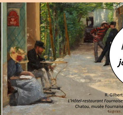
R. Gilbert, L'Hôtel-restaurant Fournaise, Chatou, musée Fournaise GILBERT.

A travers des peintures des Petits Maîtres de Bords de Seine (Derain, Lebourg, Réalier-Dumas, De la Villéon...), des gravures et différents objets, la collection du musée célèbre la beauté des paysages d'Île de France et l'aventure pleine d'humour des canotiers.