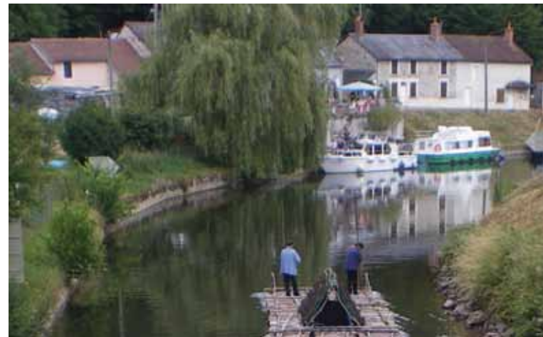
© Claire Xuan - Elements Edition 2014