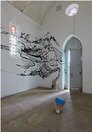
© Baptiste Roux, Trait de coupe au sein des Saints , chapelle Saint-Jean, Le Sourn, L'art dans les chapelles , 2012, © S. Cuisset

20 artistes contemporains / 26 sites patrimoniaux / 4 circuits