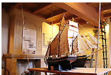
© musée de la vilaine maritime

Plus d'infos : Tourisme Arc Sud Bretagne 14 rue du Dr Cornudet 56130 La Roche-Bernard tél / 02 99 90 67 98 www.arc-sud-bretagne.fr