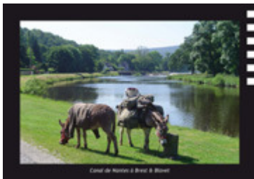
Canal de Nantes à Brest & Blavet