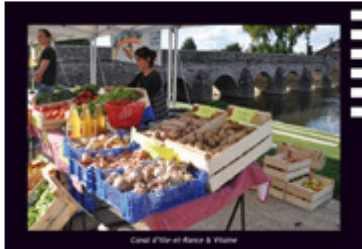
Canal d'Ille-et-Rance & Vilaine